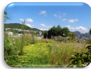
広い空・四季の花・人気の庭園