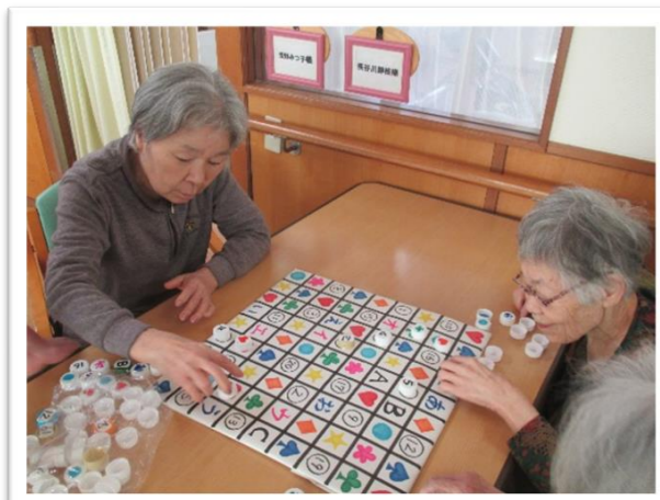
脳トレゲーム！！ 真剣勝負！！