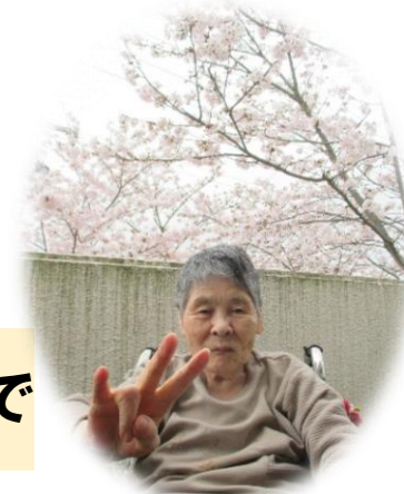
綺麗な桜が咲きました