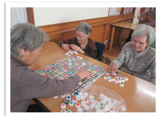
どちらが勝ったのかな??