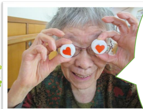
目がハートになっ ちやっただよ