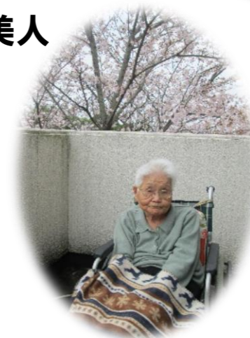
今年も、こすもす園で