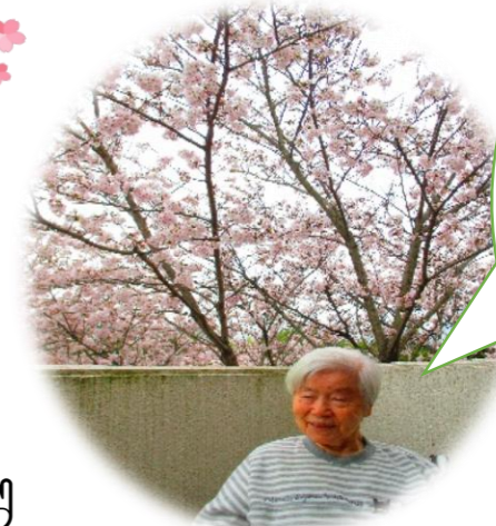
今年も満開 になったね