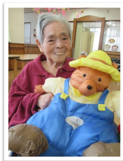
私の顔より大きいでしょ～（笑）