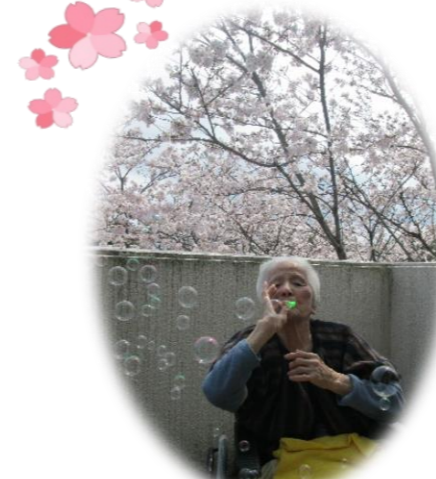
シャボン玉飛んだ～♪ 屋根まで飛んだ～🎵