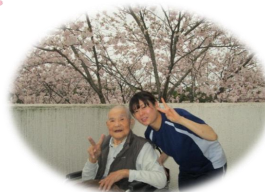
かわいい子と一緒にパチリッ📷