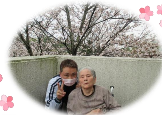
ポカポカ陽気の中で お花見しました