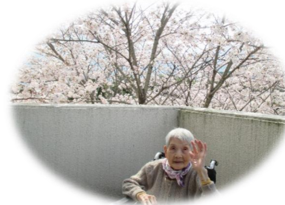
桜に負けないくらいの美人